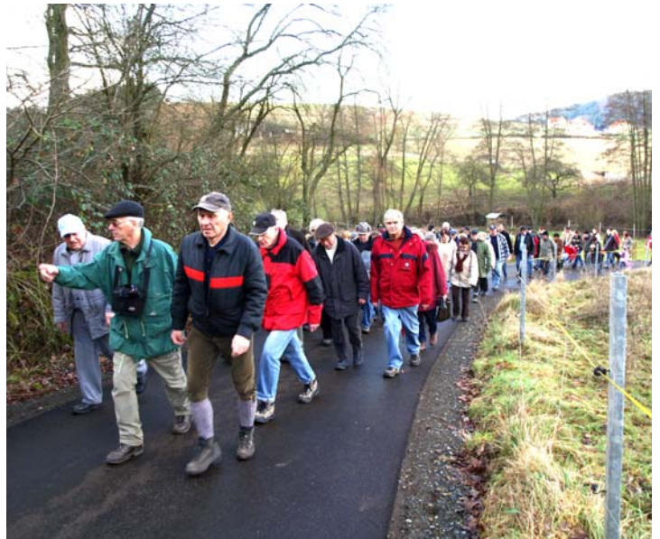
Wanderung zum Sauerberg