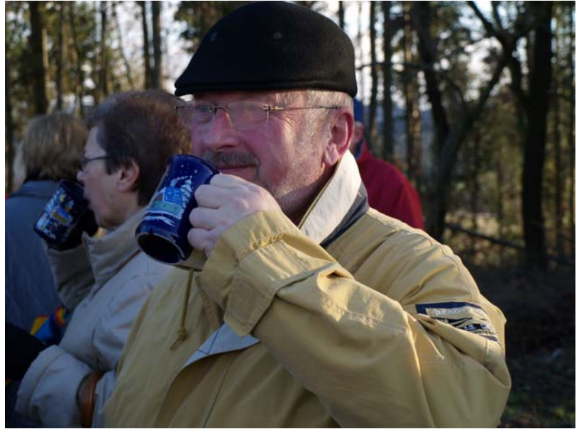
Glühweinpause an den Hügelgräbern