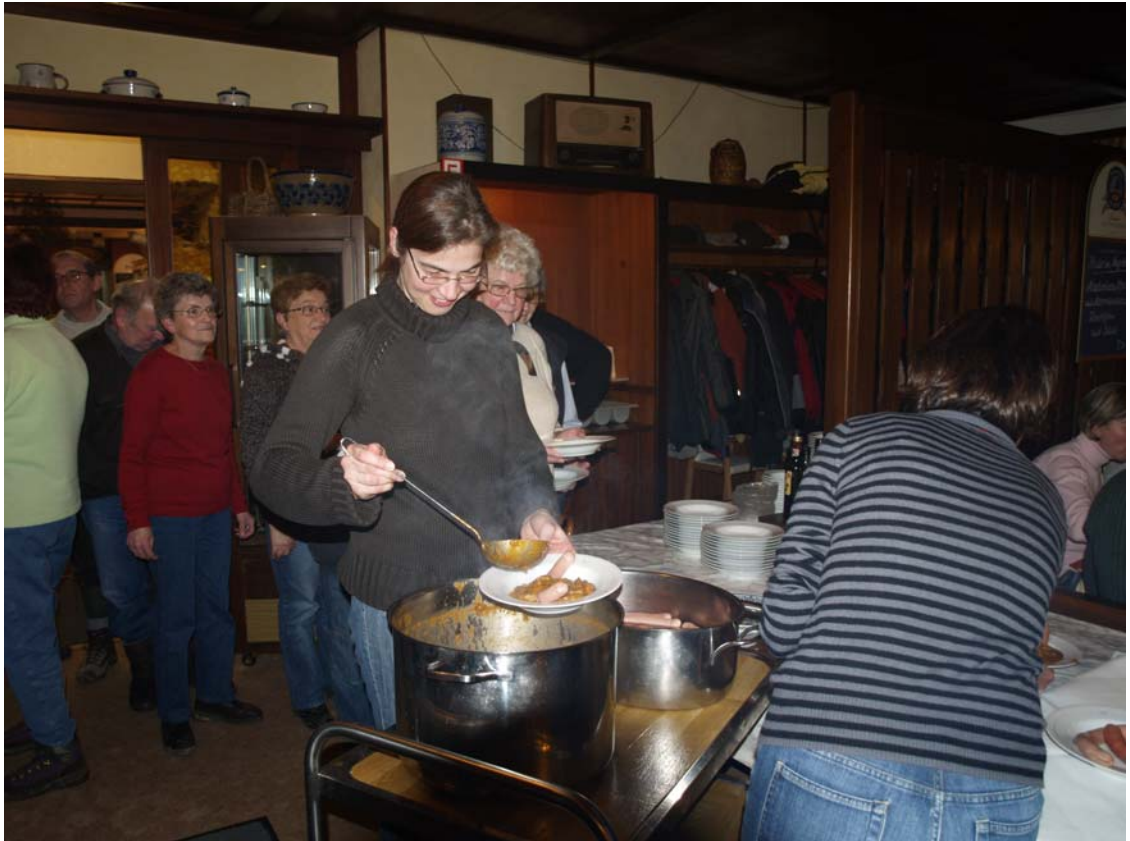
Abschluss bei Suppe und Würstchen im Gasthaus „Zur Einsamkeit“