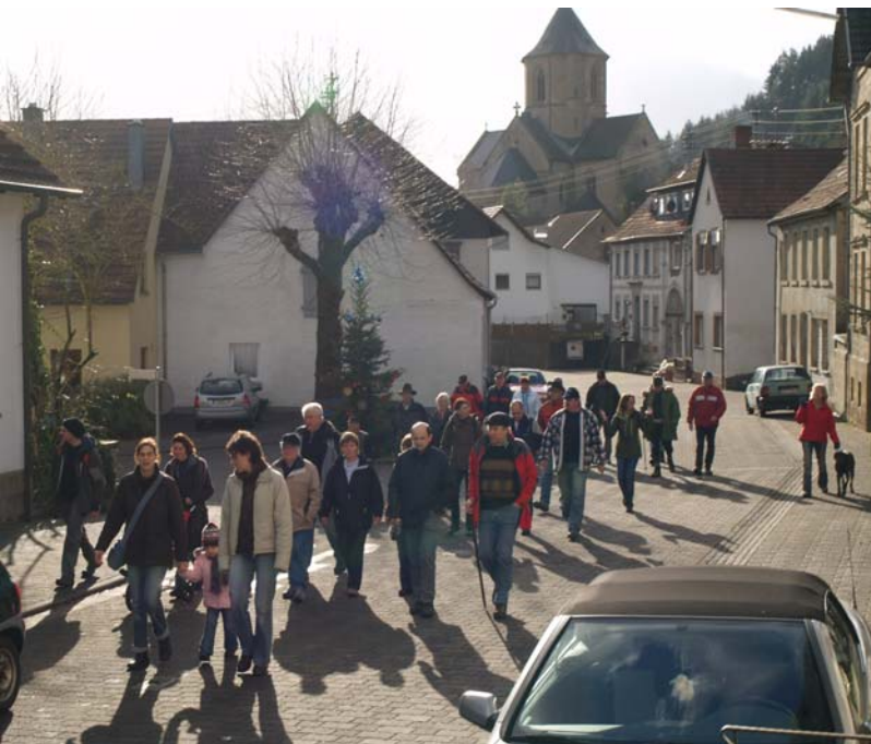
Unterwegs zum Kindergarten