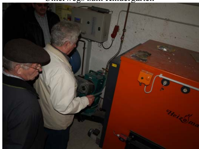
Besichtigung der neuen Pelletheizung